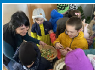
6-7 Základní škola, mateřská škola, družina