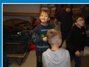
8-9 Společnost a kultura - dění ve skautu