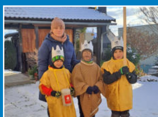
4-5 Tříkrálová sbírka v naší obci