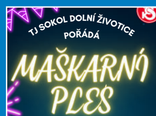
11 Pozvánky na akce konané v obci