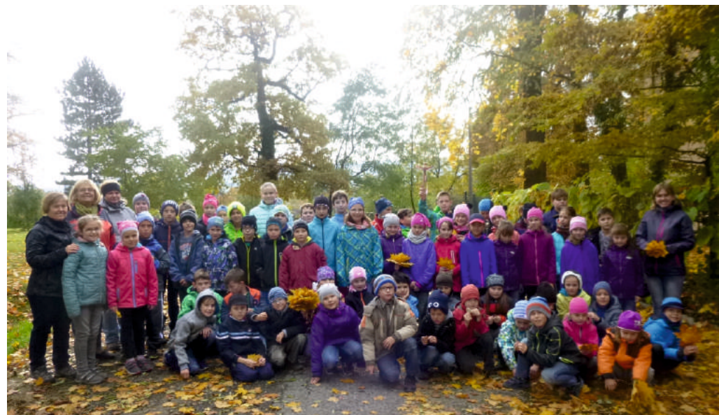
Stromová štafeta a štafetový běh