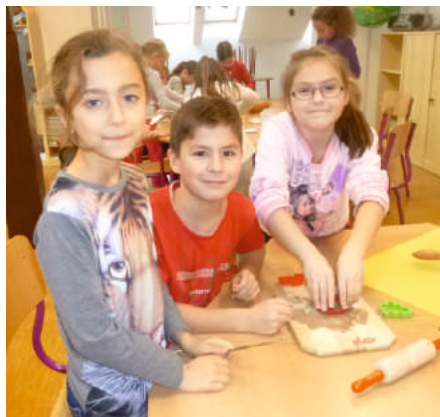
Pečení perníčků v ZŠ