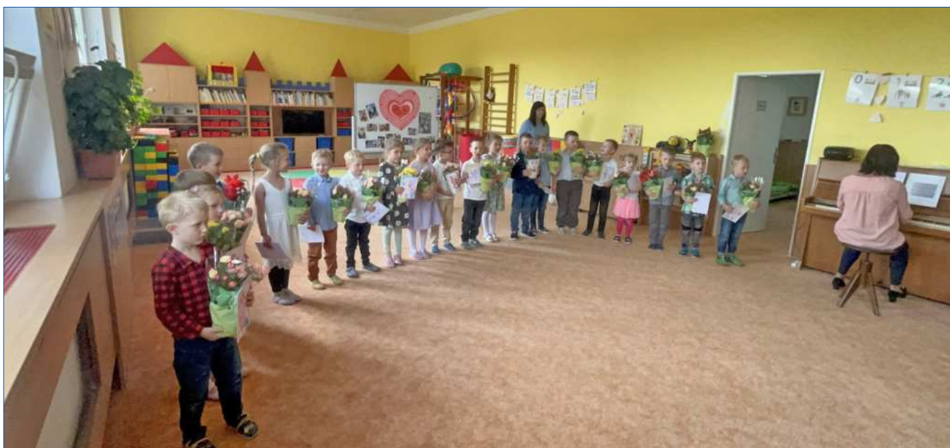
Den matek – Sluníčka