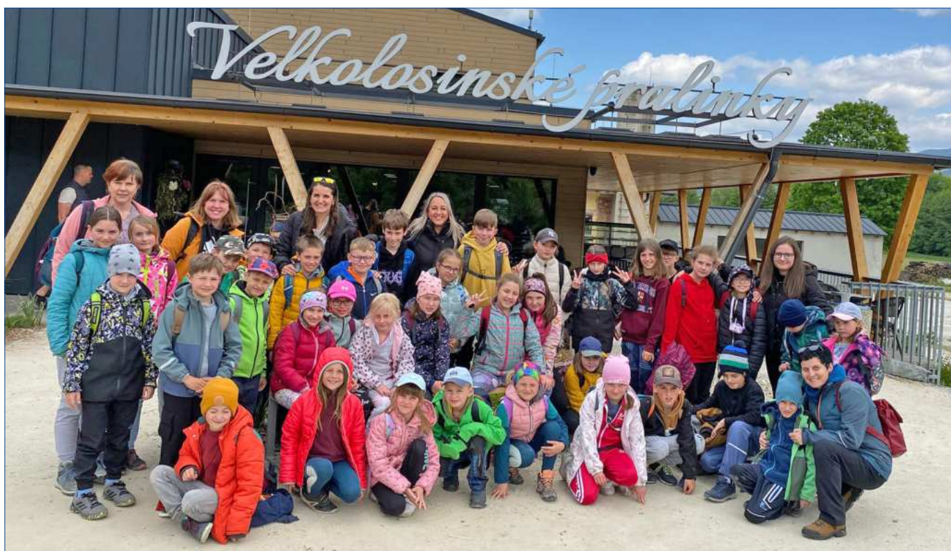
Škola v přírodě 2025

Žáci základní školy taktéž besedovali v místní knihovně, měli možnost jet na exkurzi v Charitě Opava, která