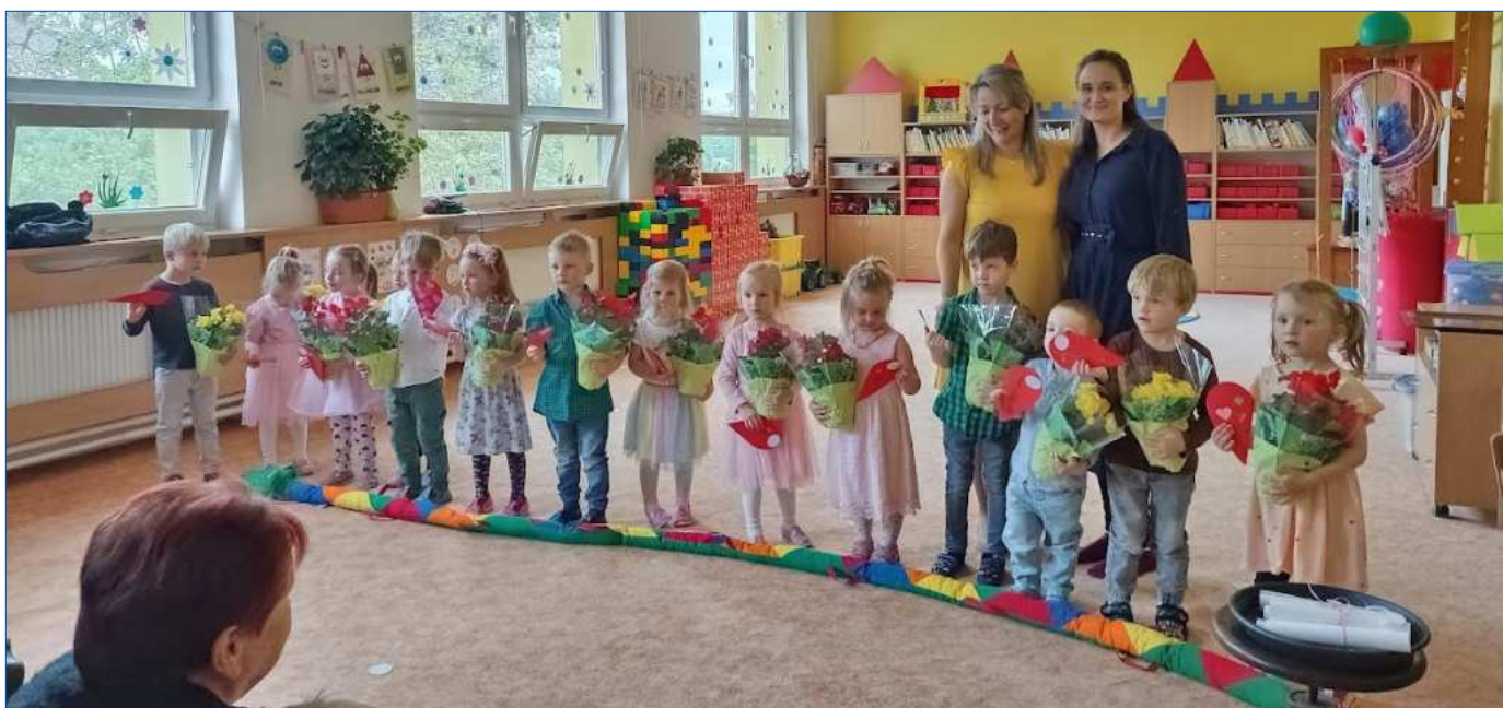
Den matek – Broučci