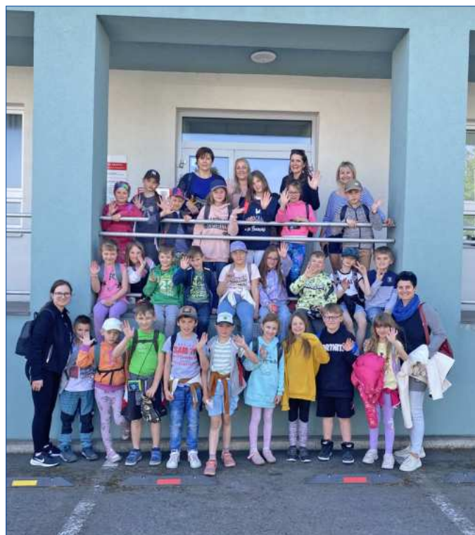
Charita Opava – exkurze s workshopem

Výčtem těchto aktivit náš společný školní rok ještě nekončí. 27. května nás čeká radostná událost. Všichni společně můžeme oslavit 115. výročí naší školy, na které Vás srdečně zvou. Červen je nejen obdobím zkoušení, písemek a samotného vysvědčení, ale také výletů, projektů, loučení s páťáky, předškoláky a další mnohé aktivity. V základní škole se můžeme těšit na polytechnickou výchovu ve spolupráci s MAS Opavsko, kterou nám zafinancoval zřizovatel, kterému tímto děkujeme.