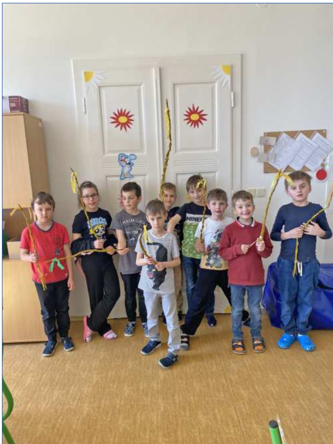
Pletení pomlázek ve ŠD

V uplynulých měsících byly naše činnosti z velké části zaměřené na jarní tematiku. V rukodělných činnostech jsme vytvořili spoustu jarních dekorací převážně z vlastnoručně nasbíraných přírodnin, kterými jsme zahalili do jarního hávu prostory školy. Na naše budoucí spolužáky jsme pamatovali s dárečky k zápisu do první třídy. Před Velikonocemi jsme kromě malování kraslic společně nařezali vrbové pruty, z kterých si hoši i některá děvčata upletli pomlázky. Měsíc duben byl z velké části věnován ochraně naší planety. Den Země, který připadá na 22. dubna, je příležitostí připomenout si důležitost ochrany přírody a životního prostředí. Děti se aktivně zapojily do několika činností, které rozvíjely jejich vztah k přírodě a učily je, jak mohou samy přispět k její ochraně. Společně jsme se vydali sbírat odpadky po naší vesnici, čímž jsme přispěli k její čistotě. Z recyklovatelných materiálů děti v týmech vyrobily vesmírné rakety. Důležitou součástí dubnových aktivit naší družiny byla dopravní výchova. Děti si hravou formou osvojovaly základní zásady bezpečného chování v silničním provozu. Řešily kvízy, vyplňovaly pracovní listy, vybarvovaly omalovánky a také soutěžily. Nabyté znalosti měly možnost si ověřit v závěrečné šipkované. Naše dubnové aktivity jsme zakončili turnajem v pexesu a deskových hrách. První květnový týden byl věnován vědomostním soutěžím, hádankám a kvízům. Do školní družiny zavítal neobvyklý host – agama vousatá, domácí mazlíček paní