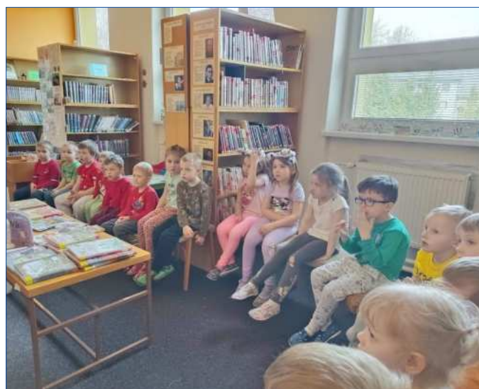
Návštěva místní knihovny – Sluníčka

Děti si také užily naučný program Klaun Dopraváček, při kterém se zábavnou formou učily pravidla silničního provozu. Navštívili jsme muzeum v Opavě, kde děti objevovaly nové poznatky, prohlížely si exponáty a užily si společný výlet.