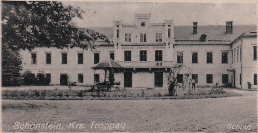
Schönstein, Krs. Troppau